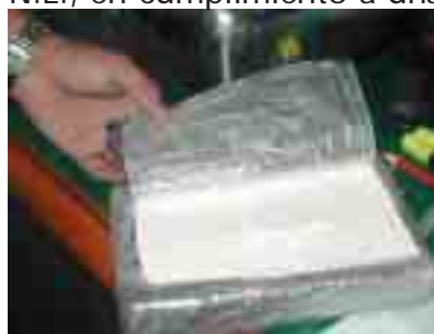
Volúmenes asegurados de drogas, 2002